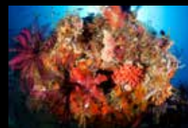
6 • L'incroyable biodiversité des récifs coraliens.