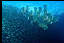
2 • Un banc de platax croisant des fusiliers.