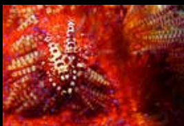
7 • Un couple de crevettes de Coleman.