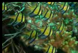
8 • Banc de gracieux poissons-cardinal de Banggai.