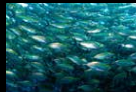
3 • Le déplacement compact des fusiliers à bandes jaunes.