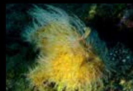
9 • Rencontre avec un poisson-crapaud chevelu.