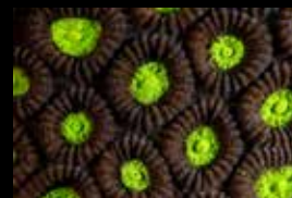
12 • Accord de couleurs pour les polypes de corail dur.