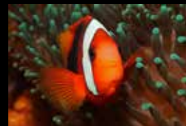
15 • Un poisson-clown veille à l'abri de son anémone.