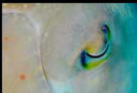
13 • Gros plan sur un oeil de seiche.