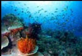
1 • Die unberührte Welt der indonesischen Korallenriffe.