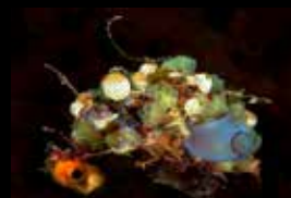
11 • Die wundersame Welt einer Seescheidenkolonie.