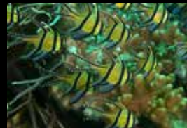
8 • Ein Schwarm anmutiger Banggai-Kardinalfische.