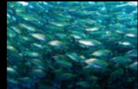
3 • Ein dicht gedrängter Schwarm Gelbbandfüsiliere.