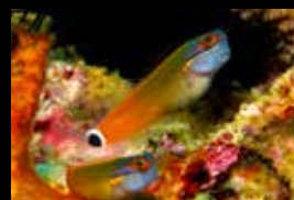
14 • Spiel der Farben von Korallen und schlanken Blennys.