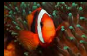
15 • Ein Tomaten-Anemonenfisch im Schutz einer Seeanemone.