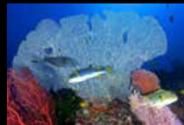
5 • Einige Süsslippen vor Gorgonien.