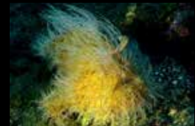
9 • Begegnung mit einem Anglerfisch.