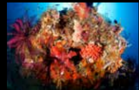
6 • Die unglaubliche Biodiversität der Korallenriffe.