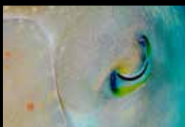
13 • Das Auge eines Tintenfisches in Grossaufnahme.