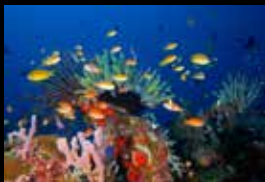
4 • Ein harmonisches Bild aus Farben und Formen.