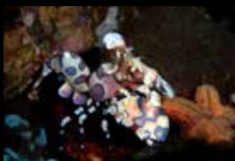
10 • Die Eleganz einer Harlekin-garnele.